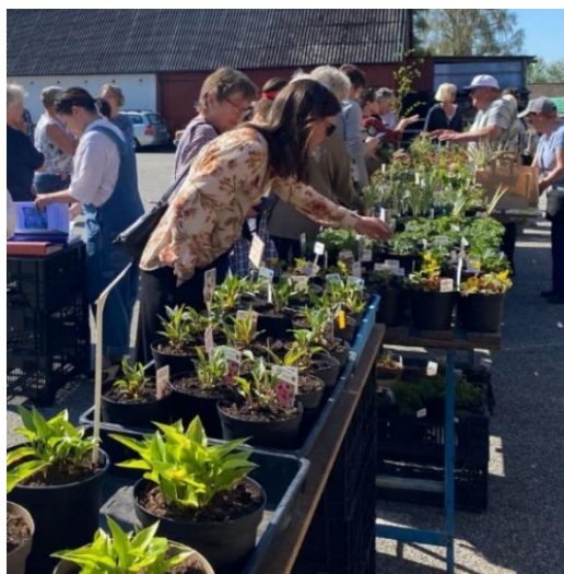
Växtmarknad våren 2023.

Allmänheten hälsas välkomna att handla på marknaden!