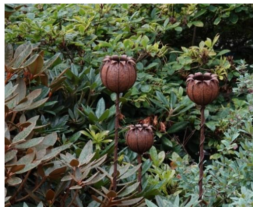
Tommys smidesarbeten.

Det har blivit dags för lunch och då beger vi oss till Gåsapågarna på Bialitt, en restaurang med genuin skånsk atmosfär. Här äter vi en god middag.