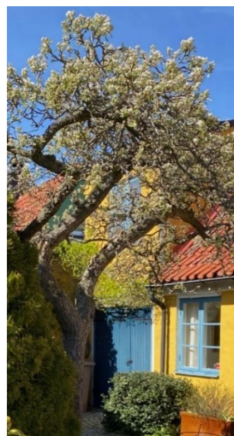
Trädgård hos Nörngaard.

Samlingsplats: Simris Trädgård, Byadammsvägen 4 i Simris