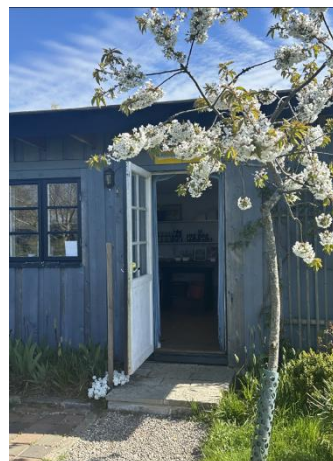
Sanna Töringe och bilder från trädgården på Österlen