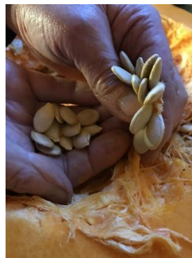
Fröer med varierande utseende