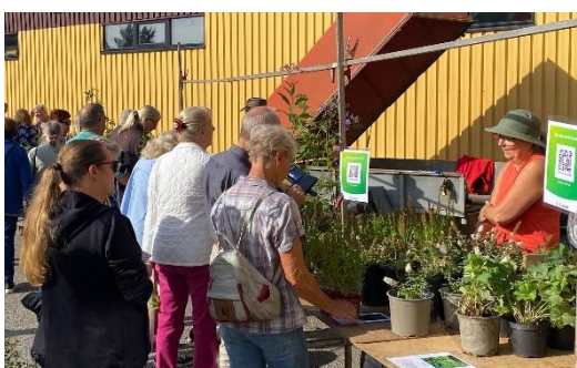
Växtmarknad hösten 2025