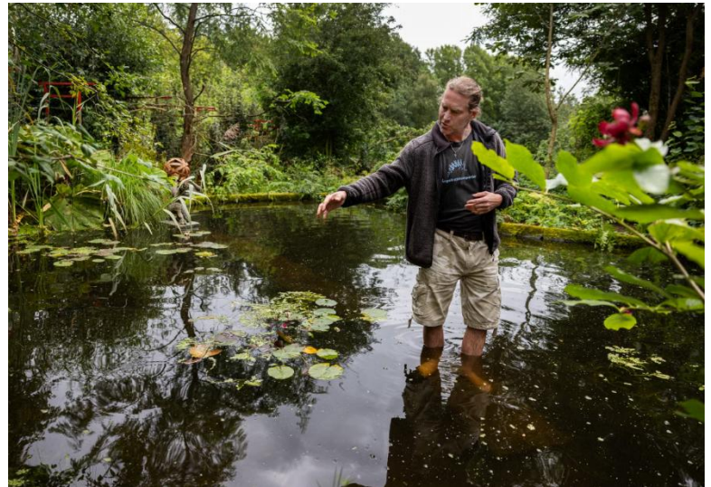
Ängelkott Bocz i sin naturpool som är formgiven med skogstjärn som förebild.

Anmälan: senast söndag 26 april till info@sjobotradgard.se