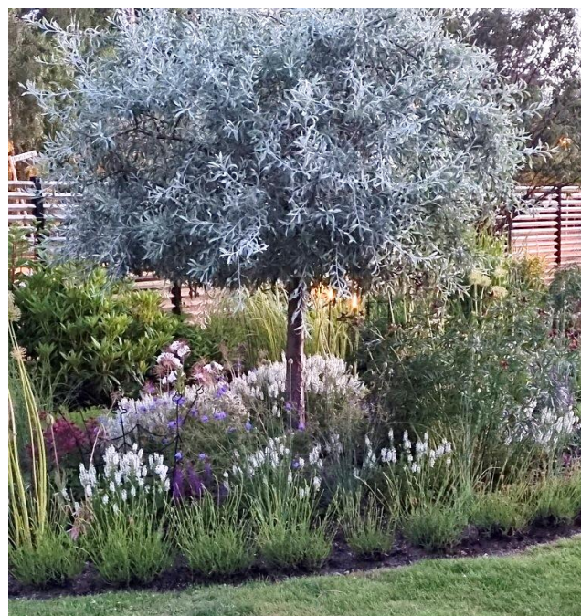
Silverpäron – Pyrus salicifolia

Anmälan: Senast måndag 9 juni till info@sjobotradgard.se Begränsat antal platser. Adress: Information skickas via mejl i samband med att anmälan bekräftas.