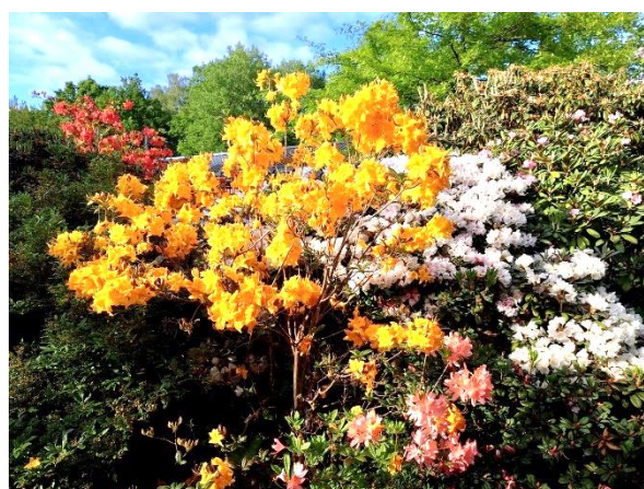
Rhododendron och Azalea i vackra färger i trädgården i Ludvigsborg.