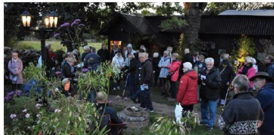
Blandade aktiviteter med trädgårdsföreningen.