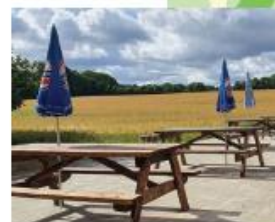
Björk's Ringsjön Fiskbutik & Rökeri