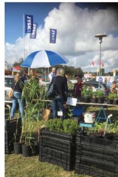
Pelargonier i Gluggstorp.