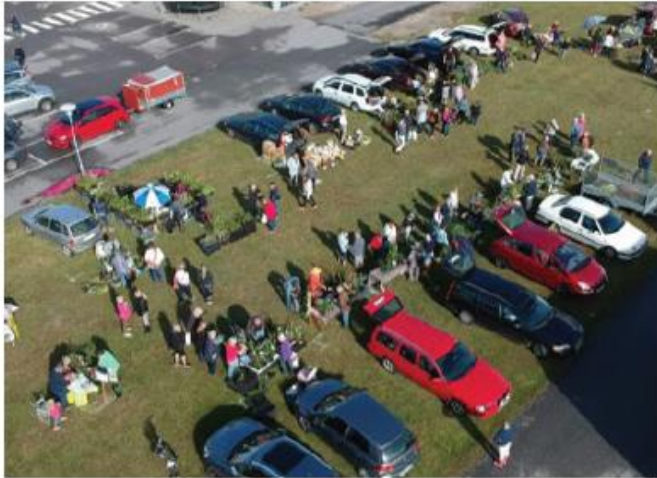
Växtmarknad från ovan.