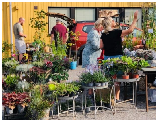
Växtmarknad 2023.

Efter bekräftad anmälan betalas avgiften in på Sjöbo Trädgårdsförenings bankgiro 5282-764. Vi välkomnar föreningens medlemmar att sälja på växtmarknaden. Allmänheten hälsas välkomna att handla på marknaden.