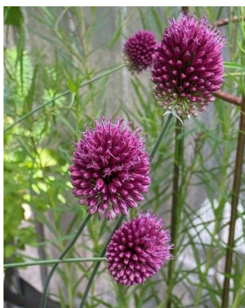
Allium sphaerocephalon, klotlök