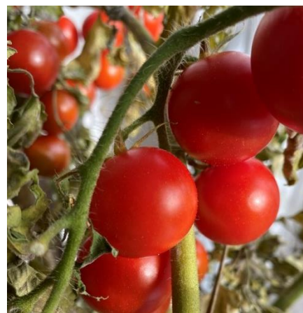
Tomat 'Meili Mehai'.