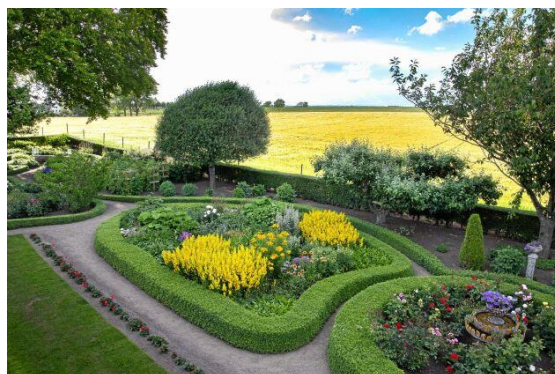
Bilder från trädgårdarna. Till vänster Almas hus. Högra bilden är från Thomas Perssons trädgård i Nöbbelöv.