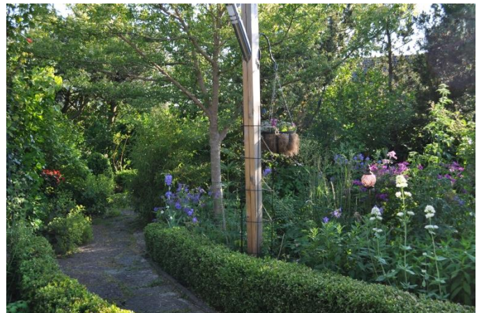
Bilder från Vivekas och Lilians trädgård