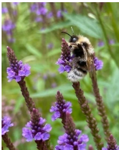
Sydsnylthumla på blåverbena, V. hastata .

Kulturens Östarp är ett friluftsmuseum som invigdes på 1920-talet och 2021 fick området ett långsiktigt skydd som kulturresevat. Ett av syftena med reservatsbildningen är att bevara den värdefulla agrara miljön och det biologiska kulturarvet med de hävdgynnade naturvärdena som representeras av örtrika marker med sitt rika insektsliv. Kulturlandskapet vid Östarp är en av de främsta lokalerna för rödlistade solitära bin i landet.