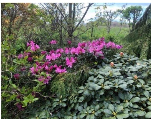
Klematis och Rhododendron i trädgården i Nällevad.