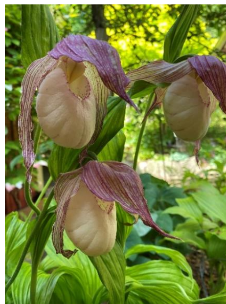
Ett par olika Cypripedium, Guckosko.