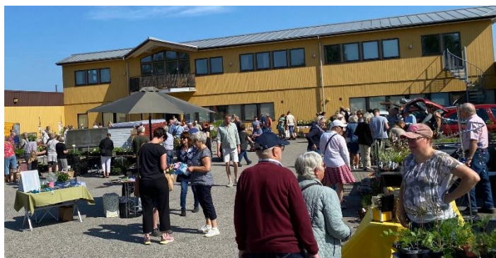
Växtmarknad maj 2024.

Efter bekräftad anmälan betalas avgiften in på Sjöbo Trädgårdsförenings bankgiro 5282–2764 . Vi välkomnar föreningens medlemmar att sälja på växtmarknaden. Allmänheten hälsas välkomna att handla.