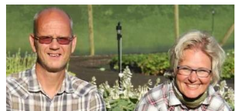
Bilder från hemsidan www.perenner.se

Adress: Lilla Uppåkravägen 92, 245 93 Uppåkra Kläder efter väder. Samåk gärna med tanke på begränsad parkeringsplats